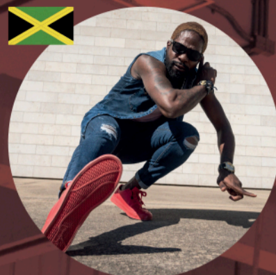
KILLER BEAN SOPREME BLAZZAZ